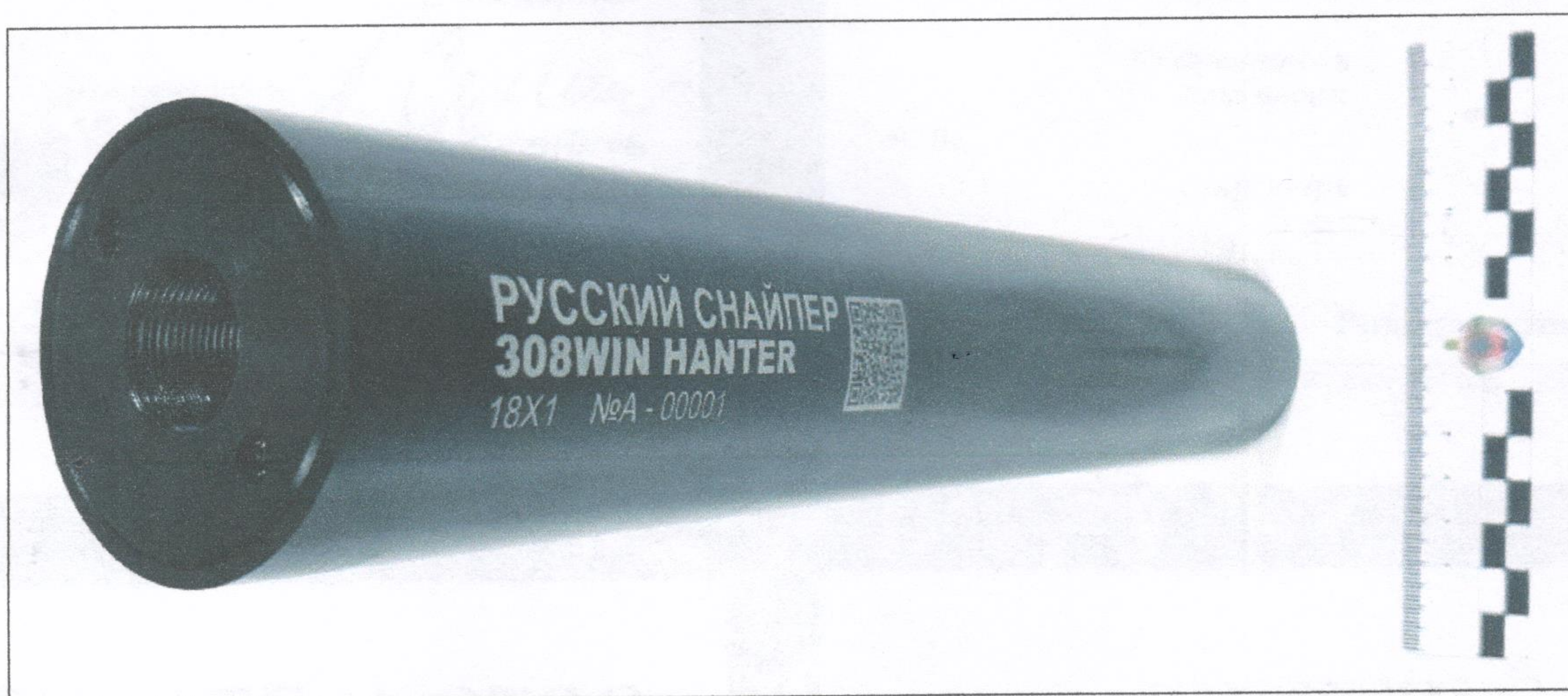
Исследование №4. Вид задней части представленного объекта.